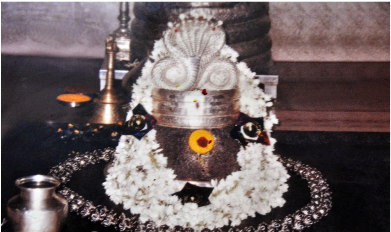
ഹംപി വിരുപാക്ഷമൂർത്തി. ഈ ശിവലിംഗത്തിന്റെ സ്ഥാനത്താണ് രാജുവിനെ സംഘം ദർശിച്ചത്. വലിയ കണ്ണുകളുള്ള ഒരു വെള്ളിമുഖം കൊണ്ട് ഈ ശിവലിംഗത്തെ പൊതിയും.

ഈ അനുഭവം നിരവധി ആളുകൾക്ക് അറിവുള്ളതായിരുന്നു, സ്വാമി എല്ലായിടത്തുമുണ്ടെന്നുള്ളതിന്റെ സൂചനയായിരുന്നു അത്. അവിടുന്ന് വിരുപാക്ഷക്ഷേത്രം സന്ദർശിച്ച വേളയിൽ, അവിടുന്ന് ക്ഷേത്രത്തിനു പുറത്തായിരുന്നപ്പോൾ, അവിടുന്നിനെ ക്ഷേത്രത്തിന്റെ ശ്രീകോവിലിന്റെ ഉള്ളിലും കാണപ്പെടുകയുണ്ടായി.