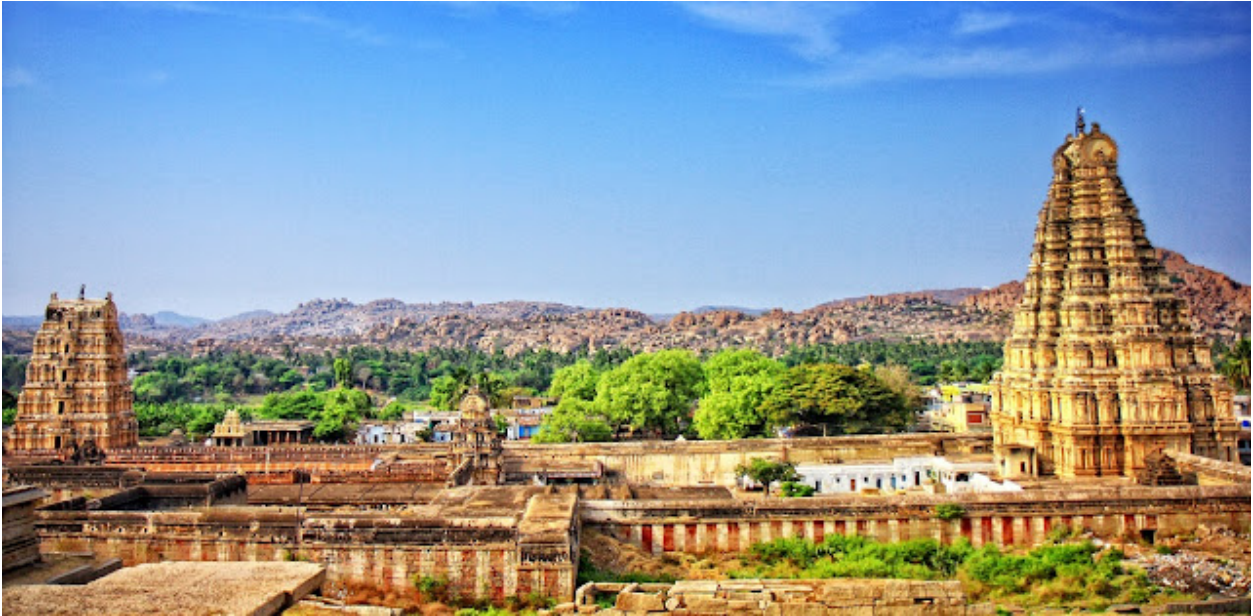
ഹംപി വിരുപാക്ഷക്ഷേത്രം. 3 ഗോപുരങ്ങളും ചിത്രത്തിൽ കാണാം.

ഞാനന് തീരെ ചെറിയ കുട്ടിയാണ്! അദ്ദേഹം എന്റെ ഇരുകൈകളും കുട്ടിപ്പിടിച്ചുകൊണ്ട് കേണപേക്ഷിച്ചു, ‘ദയവായി വന്നാലും!’ എന്നാൽ എന്റെ ദൃഢനിശ്ചയം കണ്ടിട്ട്, അദ്ദേഹം കൂടുതൽ നിർബന്ധിച്ചില്ല.”