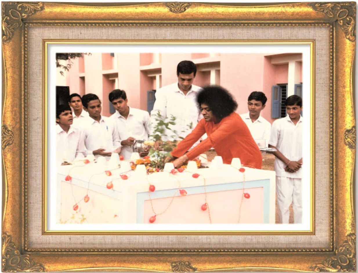
ഹോസ്റ്റലിൽ തുളസിച്ചെടി നടുന്ന സ്വാമി

പിറ്റേന്ന് രാവിലെ, അവിടുന്ന് അവരെ വിളിപ്പിച്ചു, എന്നിട്ട് തലേന്ന് വൈകുന്നേരത്തെ കാര്യങ്ങളെപ്പറ്റി ചോദിച്ചു. ആദ്യം, അവർ ഓരോന്നും നിഷേധിച്ചു. എന്നാൽ, അവർ സിഗരറ്റ് വലിച്ചുകൊണ്ടിരിക്കുന്ന ഒരു ഫോട്ടോ സ്വാമി സൂഷ്ടിച്ച് അവർക്ക് കാണിച്ചുകൊടു