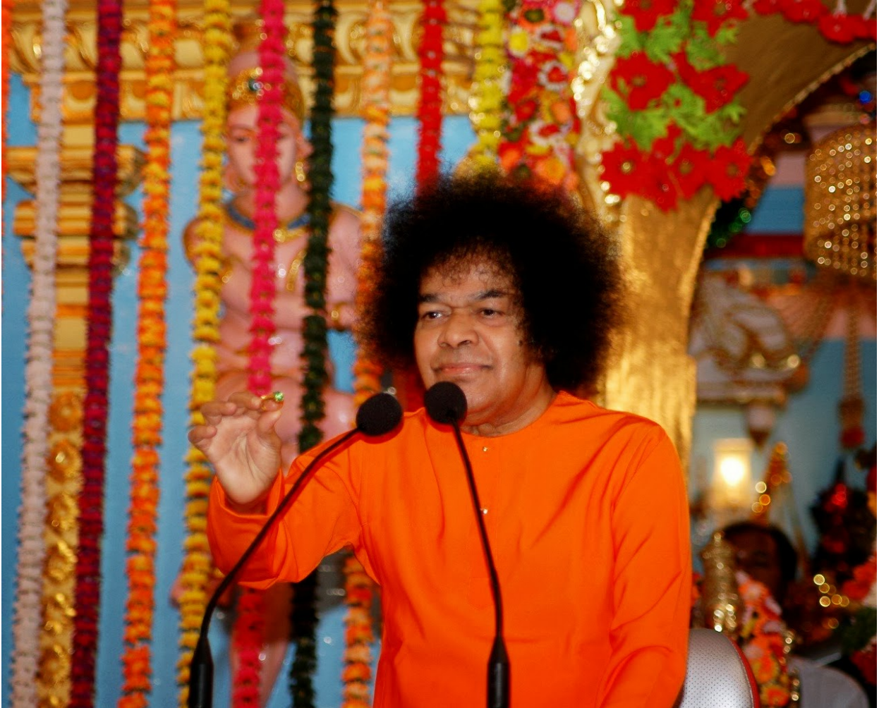
സ്വാമി അവിടുന്ന് സൃഷ്ടിച്ച ഒരു മോതിരവുമായി

സ്വാമി ചിരിച്ചു. ഇപ്പോൾ അവിടുന്ന് കുട്ടികളുമായി കളി തുടങ്ങി! “ഓ, അത് നടക്കുകയായി നിന്നോ? ഞാൻ നോക്കട്ടെ!”