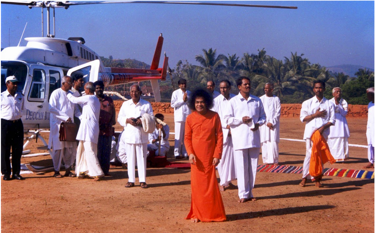
ശ്രീ സത്യസായി അളികെ സന്ദർശിക്കുന്നു-2001 ജാനുവരി 31

ബാംഗ്ലൂരിലായിരിക്കുമ്പോൾ, ജാനുവരി 31-ാം തീയതി, ഭഗവാൻ കർണാടക സംസ്ഥാനത്തെ ‘അളികെ’(Alike) എന്നു വിളിക്കുന്ന സ്ഥലം സന്ദർശിച്ചതായി ഞങ്ങളറിഞ്ഞു.